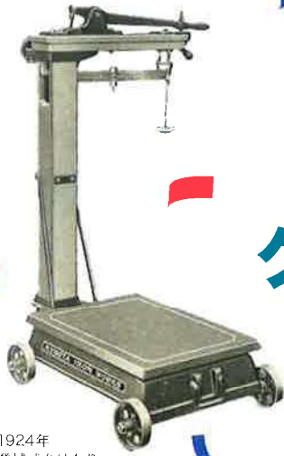
1924年 機械式台はかり

クボタの「はかり事業」は、2024年に事業100周年を迎えます。 長年の歴史で築き上げたつながりを大切に感謝の気持ちを伝えるとともに培ってきた技術を活かし、 次の時代へさらなる飛躍を追求する機会と捉えています。 “正しくはかる”ことで、社会の発展に貢献し続けてきたクボタ。 私たちはこれからも“はかる”の新しい価値を創出し、人々の豊かな未来を支え続けていきます。